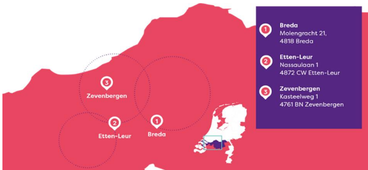
Locaties De MARQ per 31 december 2025

De MARQ is uniek omdat ze specialist is in kortdurende zorg met volledige focus op revalidatie en herstel specifiek voor mensen met meerdere ziektebeelden, waardoor zij laag belastbaar zijn bij het trainen en opnieuw aanleren van handelingen. Daarnaast is De MARQ uniek omdat zij een organisatie is die zelfstandig opereert én een coöperatie is met VVT-organisaties ( Verpleeg- en Verzorgingshuizen en Thuiszorg ) als leden; Surplus en Avoord vanaf de oprichting van De MARQ in 2017 en Thebe vanaf 1 januari 2024.